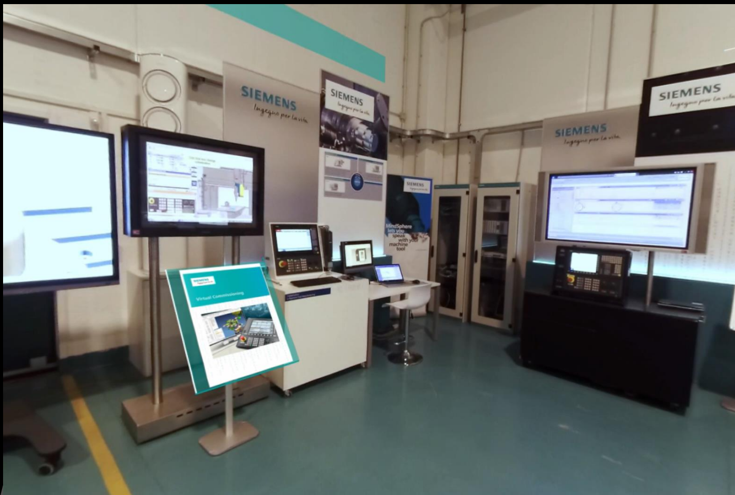
Particolare del video a 360° del centro tecnologico applicativo di Piacenza. Le grafiche ed i video incorporati in post produzione aiutano la visita e danno informazioni aggiuntive.