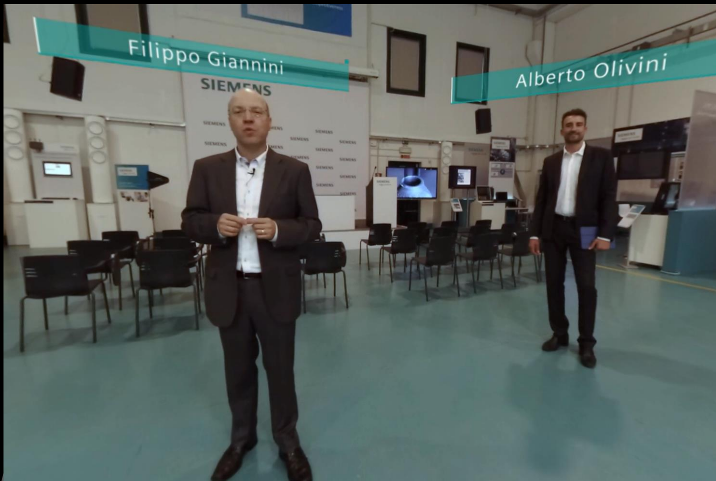
Particolare del video a 360° del centro tecnologico applicativo di Piacenza. Le grafiche ed i video incorporati in post produzione aiutano la visita e danno informazioni aggiuntive.